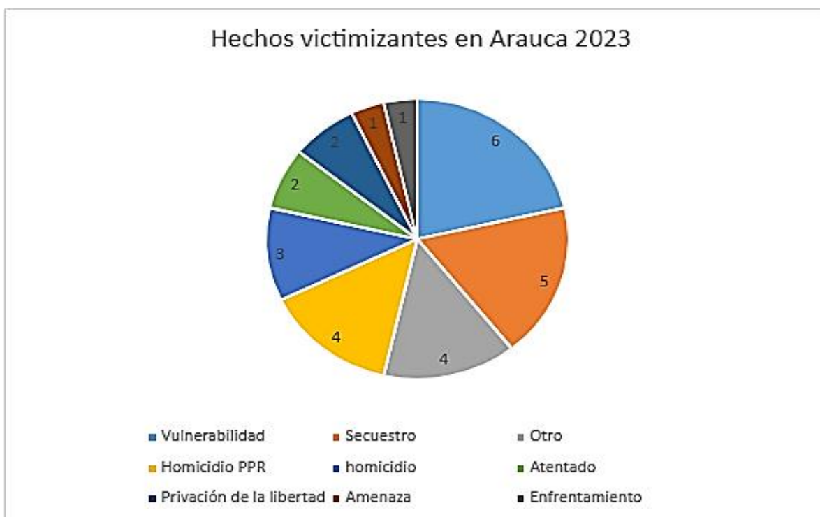
Gráfica 2. Total de hechos victimizantes en Arauca 2023

Cabe resaltar que aun en medio de la tregua firmada entre el Gobierno del presidente Gustavo Petro con grupos insurgente, en el marco de la Paz Total mediante los decretos 0801 de 2023 18 y 1117 de 2023 19 en los cuales el Gobierno Nacional decretó el Cese al Fuego Bilateral y Temporal de carácter Nacional, en el marco de los acercamientos, han ocurrido asesinatos, secuestros y desapariciones forzadas de firmantes, quienes son señalados por uno u otro bando, de ser colaboradores de su contendor.