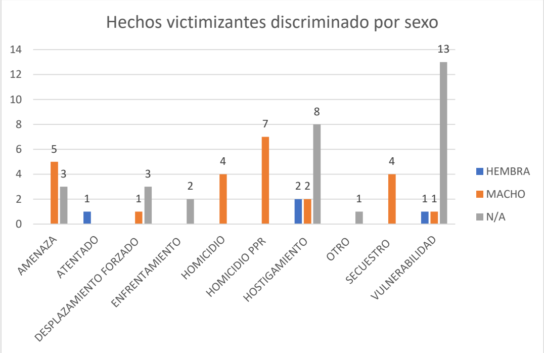
Gráfica 3. Total de hechos victimizantes discriminado por género

*Nota: El término “No Aplica” (N/A) se toma cuando las afectaciones son en contra de comunidades rurales, urbanas, ETCR o NAR.