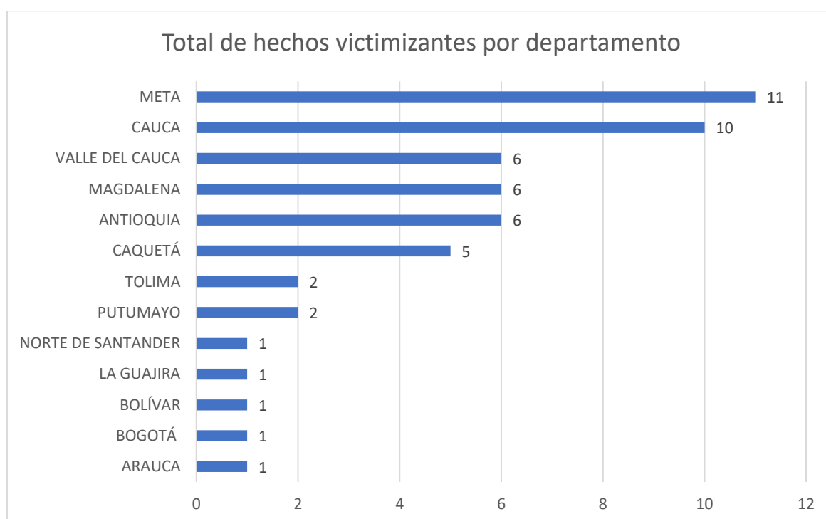
Gráfica 2. Total de hechos victimizantes por departamento