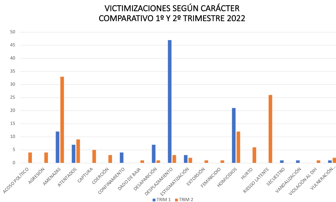
Imagen 5: Gráfico comparativo del primer y segundo trimestre del año de las victimizaciones según carácter.